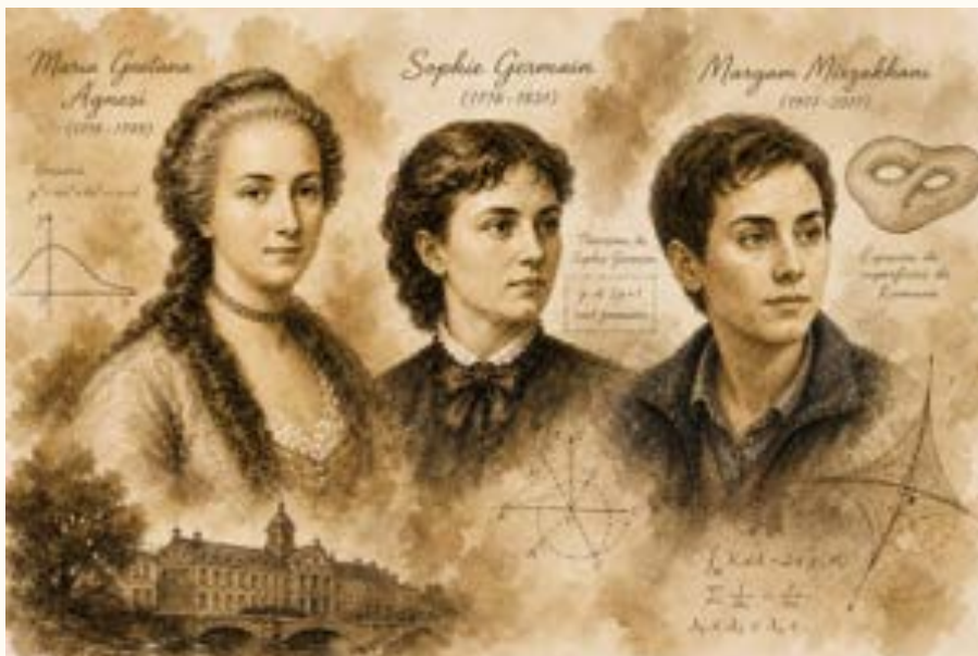
Imagen generada con inteligencia artificial (ChatGPT, OpenAI), a partir de descripciones textuales

Sus contribuciones abarcan, principalmente, la teoría de números y la teoría de la elasticidad. En el primer campo, hizo algunos avances importantes en torno al último teorema de Fermat: logró demostrarlo para una clase de exponentes primos p .