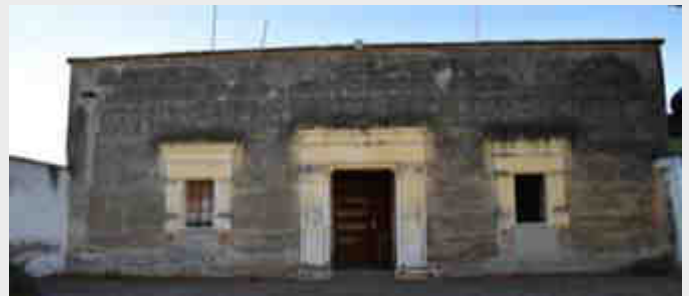
Imagen 01. Técnica de rajueleado en la fachada principal de la galería de la biblioteca Amoxcalli

En este inmueble la técnica del rajueleado es la parte creadora del espíritu indígena, cuya expresión y manifestación cultural, donde la sociedad plasma su esencia, ya que por naturaleza el hombre tiene esa necesidad de expresar y manifestar sus sentimientos, experiencias y vivencias a través de las artes decorativas.