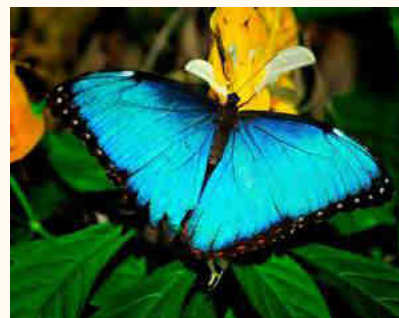
Figura 1. Fotografía de un ejemplar Morpho didius , imagen tomada de: https://www.mariposas.wiki/imagenes-fotos-de-morpho-didius-jpg .

NOTA: La presente publicación es el resultado del trabajo realizado en la materia Documentación para Textos Científicos (Optativa, 6° Semestre), en la Unidad Académica de Ciencias Biológicas, U.A.Z.